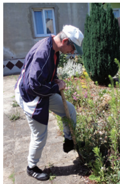
Dali jsme naší zahradě novou tvář