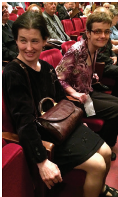
Muzikál Hello Dolly byl úžasný