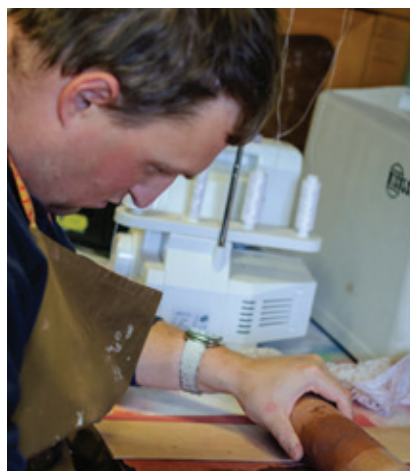
V Plamínku válíme