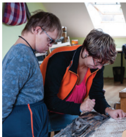
Vyrábět na tkalcovském stavu není žádná věda