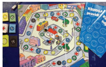
Vytvořili jsme hru s názvem KRIMIGAME