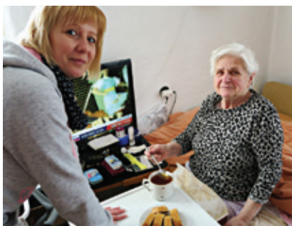
Svačinka, povídání a pohoda

Za nefinanční podporu Jubilata děkuje Plamínku pro osoby s postižením, ZŠ Dobřany a dále Klubu Echo pro děti a mládež Dobřany, ZŠ Merklín, Restauraci Na Růžku v Dobřanech, ZUŠ J. S. Bacha v Dobřanech a COOP Dobřany. Ti všichni nám v roce 2015 pomohli konkrétními činy a aktivitami se zajištěním provozu služby anebo s kulturním programem pro naše uživatele.