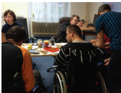
Sešli jsme se na Halloweeneské party

Děkujeme všem přátelům, kamarádům a bývalým zaměstnancům za jejich podporu.