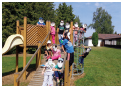
Momentka z letního tábora

Děkujeme za spolupráci organizaci Latus pro rodinu, o.p.s., za podporu a inspiraci v doprovázení pěstounských rodin a za partnerství v osvětové kampani V pěstounské rodině jsem doma. Děkujeme za podporu firmě UNILEASING, která finančně podpořila rozvoj plaveckého klubu Chobotničky do lokality Sušice.