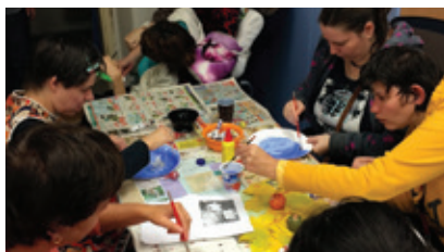
Příprava na Halloweenskou party