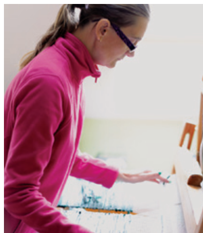
V Plamínku vyrábíme krásné věci