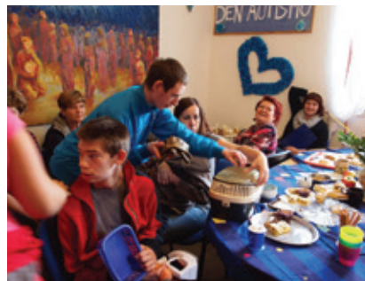
Radostné štrůdlování 2015