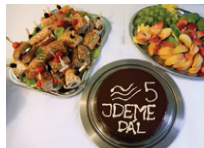
Dort k 5. narozeninám služby