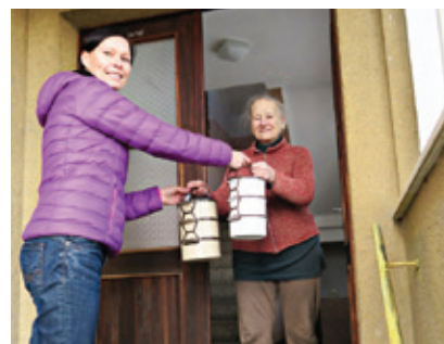
Obědy již jsou na svém místě