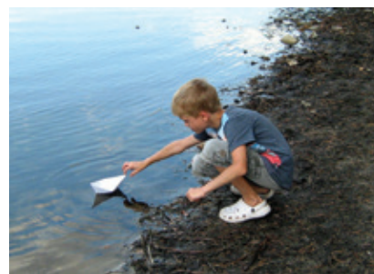
Dostáváme rodiny na jednu loď