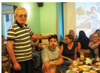
Oslavy 5 let fungování služby