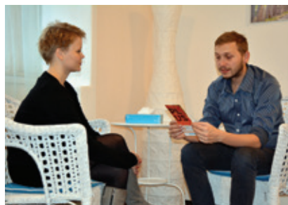
Konzultace v krizovém centru Plus