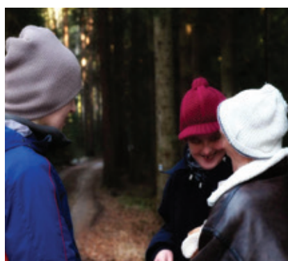
A jde se houbat

Děkujeme všem našim dobrovolníkům, příznivcům a podporovatelům, jimiž jsou především rodiny klientů, které využívají odlehčovací pobyty. Děkujeme za Vaš zájem a podporu.