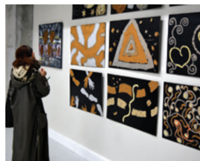
Ukázka naší tvorby v rámci mezinárodní spolupráce