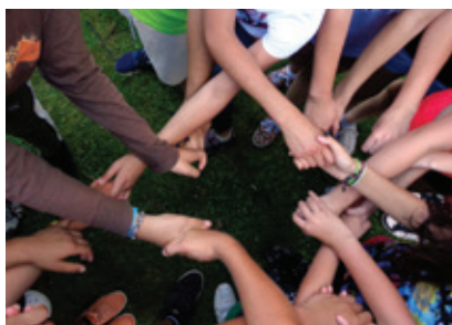
S dětmi i pěstouny jsme tým