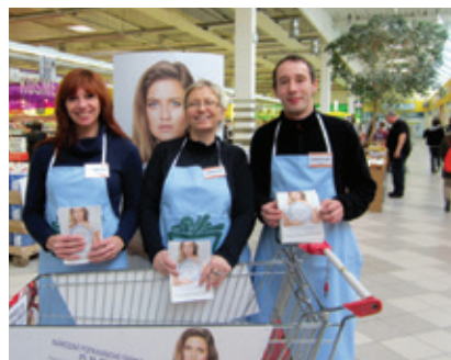
Dobrovolníci při Potravinové sbírce