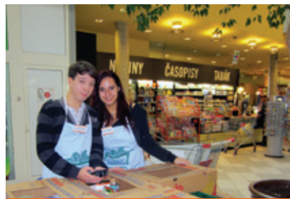
Vybrali jsme 1 900 kg potravin