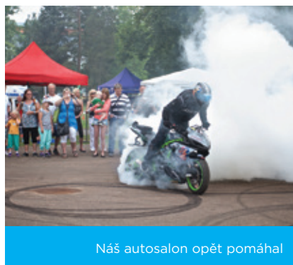
Náš autosalon opět pomáhal

Další výraznou součástí H2Ódy na Radost se stal prodej balených vod Estian, které sponzorsky poskytla firma Šumavský pramen. Obyvatelé a návštěvníci Plzeňského kraje si je mohli v letech 2014 a 2015 zakoupit na mnoha různých místech a akcích (např. Plzeňské farmářské trhy).