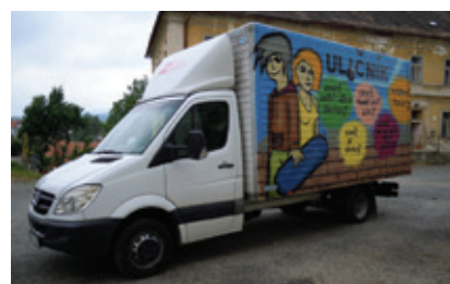
Za dětmi jezdíme s Klubem Uličník

čtyř oblastí života: volný čas a rodina, instituce, zdraví a kriminalita.