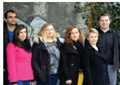
Pracovníci služby Plus