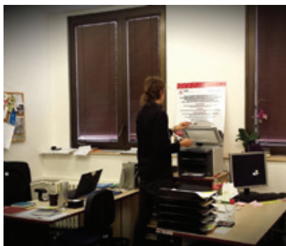
Pohled do naší kanceláře