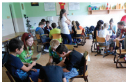
Blok primární prevence ve třídě