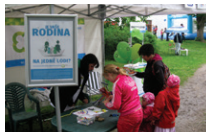
Den pro rodinu Klatovy

Poprvé jsme se letos aktivně zapojili do Noci kostelů ve dvou partnerských sborech Diakonie Západ v Plzni - Korandově a Západním. Prezentovali jsme služby Archy, ale i jiných kolegů, prodávali výrobky z našich Stacionářů a přicházejícím dětem nabízeli drobné kreativní aktivity. Sbory v průběhu roku realizovaly sbírky a předávaly nám vybavení pro cílenou podporu našich klientů. Vážíme si vzájemné možnosti podpory a děkujeme.