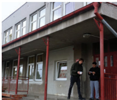
Aktivní vyhledávání a pomoc v terénu

Děkujeme především našemu partnerskému Středisku celostátních programů a služeb Diakonie ČCE v Praze, se kterým probíhá dlouholetá úzká spolupráce, a které se podílí i na chodu naší služby v Plzni.