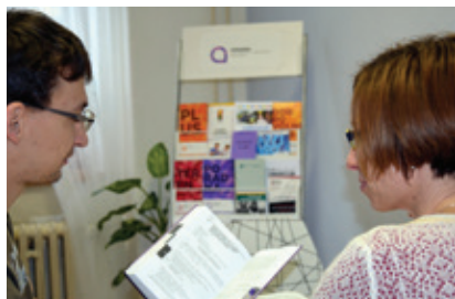
Konzultace v Poradně