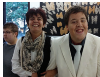
Naši umělci na vernisáži mezinárodní výstavy