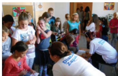
Chodbová aktivita s týmem Prevence

Děkujeme především třem základním školám v Plzeňském kraji, které s námi udržely úzkou spolupráci v oblasti poskytování služby primární prevence a umožnily tak plnit intenzivně naše poslání. Jsou to ZŠ ul. Miru Rokycany, ZŠ Dobřany a ZŠ Komenského Domažlice. Dále bychom také rádi poděkovali za intenzivní spolupráci Pedagogicko-psychologické poradně Plzeň a Středisku výchovné péče Plzeň.