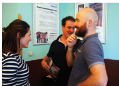
Vernisáž výstavy Cestou samostatnosti již 5 let

Za podporu a spolupráci děkujeme kolegům z Poradny pro občany v nesnážích v Klatovech, Motýl z.ú. a Sdružení Ty a já z.ú.