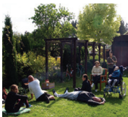
Pohoda na zahradě Domova Radost