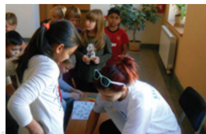
I takto se dá trávit velká přestávka