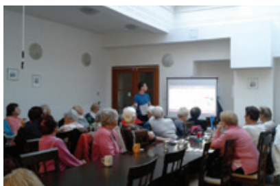
Workshop pro seniory