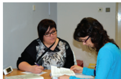
Zdarma poradíme každému