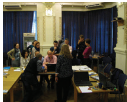
Zúčastnili jsme se jedinečného setkání v Bukurešti